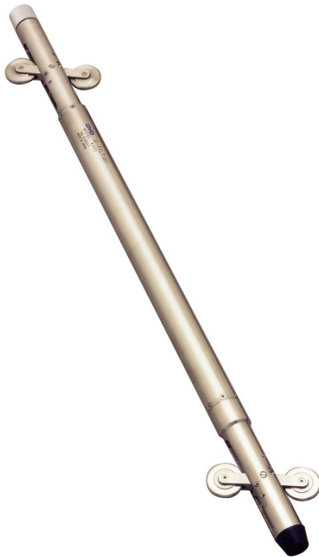
デジタルQティルト 6000 プローブ (MODEL-4480)