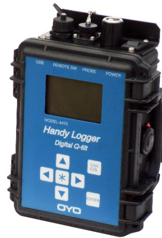
ハンディロガー デジタルQティルト (MODEL-4470)