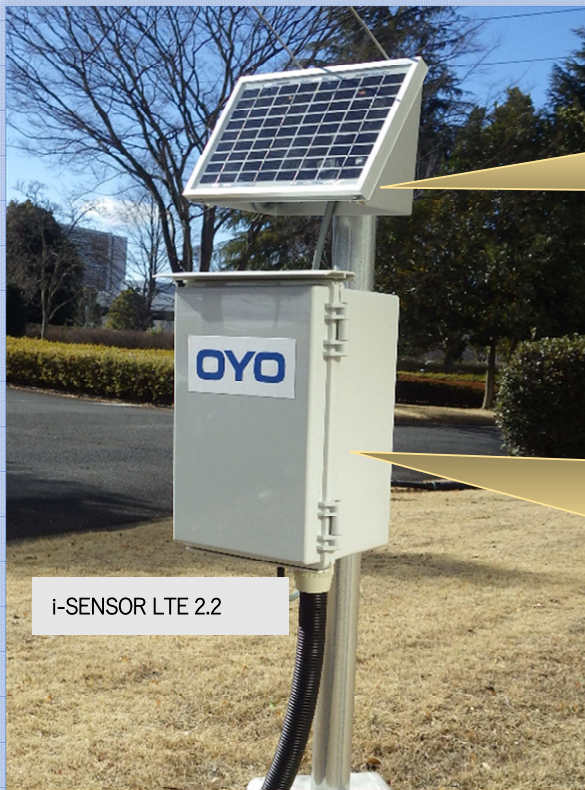
i-SENSOR LTE 2.2