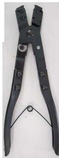
新しい工具 LP型 (18600-1071) LP型対応止め輪番号 (18010-0013)