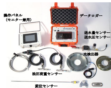
OYO HQCS-MS の概要

本技術では、OYO HQCS-MS により上記の物理値を可視化することで、 経験や暗黙知による感覚的評価から、計測物理値を用いた数値評価への転換、および高品質コア採取の精度向上とフォアマンの掘進技術の向上させることを可能としたシステムです。 亀裂性の岩盤では、送水圧が低下、掘進速度が低下、先端荷重が上昇が生じます。過剰な先端荷重によるコアの乱れを防止するために、モニタを見ながら手動で掘進速度を制御します。