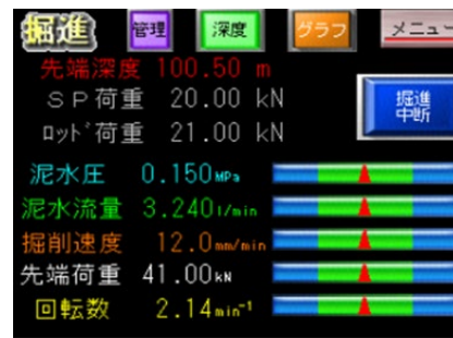
数値が表示された操作パネル (モニター)