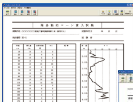
▲ 簡易動的コーン貫入試験