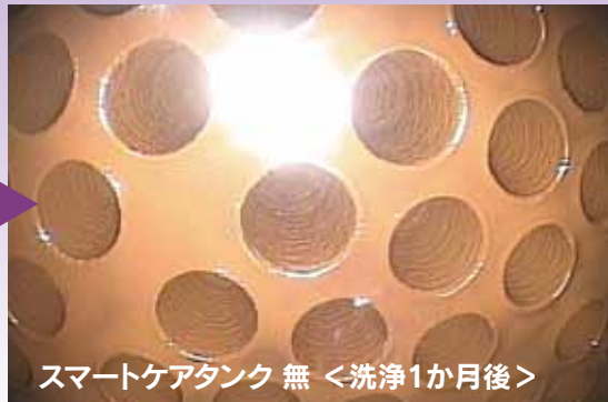
スマートケアタンク 無 <洗浄1か月後>