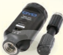
データトラッパー