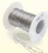
ワイヤラインキット