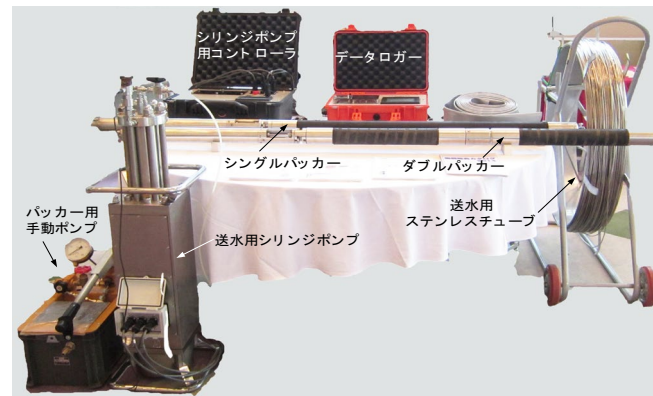
水圧破碎試験装置の概要