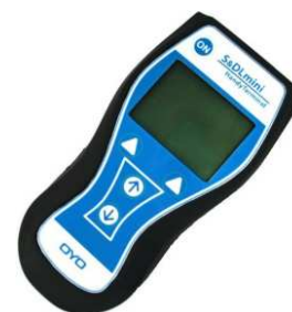
S&DL mini ハンディターミナル 本体 × 1 台