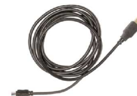
USB 接続ケーブル × 1 本