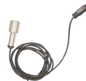
ダイレクト RD ケーブル × 1 本