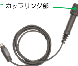
ダイレクト OP 接続ケーブル × 1 本