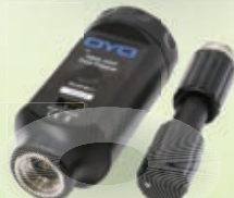
データトラッパー