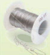
ワイヤラインキット