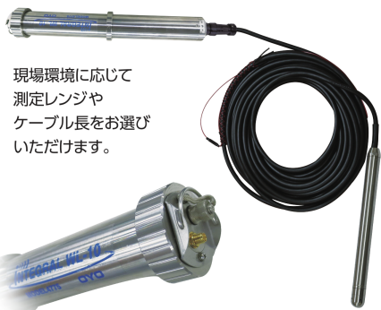
現場環境に応じて測定レンジやケーブル長をお選びいただけます。

遠隔監視に必要な機能全てを一体化した水位計です。携帯回線を利用した水位の遠隔監視が広範囲にできます。